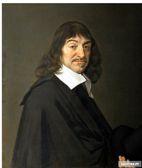
Рене Декарт (создатель «философского языка»)

С давних пор лучшие умы человечества задумывались над тем, как облегчить общение между людьми на планете, как преодолеть языковые и культурные барьеры между народами. Многие великие мыслители и энтузиасты от Средневековья до наших дней создавали и продолжают создавать проекты искусственных и плановых языков, отражая в них свою философию, идеи, взгляды на мир. В своем выступлении я постараюсь рассмотреть самые известные и значимые из этих языков, прежде всего эсперанто, которым сам активно пользуюсь в жизни и в творчестве, а также обратить внимание на процесс превращения естественных языков в искусственные, который в наше время происходит повсеместно, стирая тем самым различия между естественными и искусственными языками в принципе.