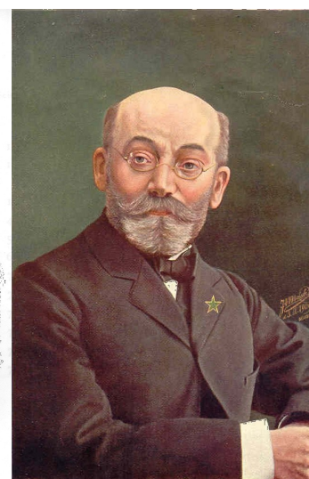
Лазарь Заменгоф (создатель «эсперанто»)

Страничка Межпредметного семинара: http://www.theorphys.fizteh.ru/mezhpr/ .